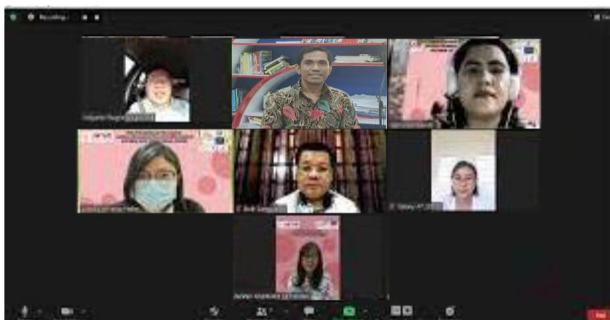
Gambar 6. Foto Zoom Bersama

Di akhir acara, pelaksana pengabdian mengucapkan terima kasih kepada Lembaga Penelitian dan Pengabdian kepada Masyarakat (LPPM) STIE Port Numbay Jayapura dan Yayasan Pendidikan Santa Clara yang telah menjadi Mitra pada pengabdian masyarakat kali ini.